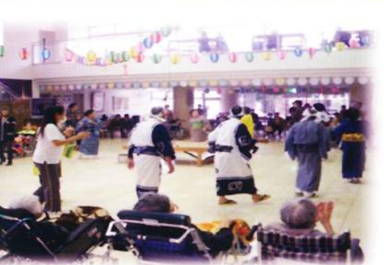
地域交流 あじさい園 秋祭り